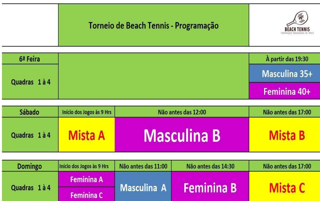
Figura 1 – Exemplo de programação a ser elaborada antes pelo árbitro geral.

* A FPT orienta aos promotores, para melhor competitividade, que o 2o jogo nos grupos com 3 duplas seja feito pelo PERDEDOR do jogo 1 e a dupla que está esperando.