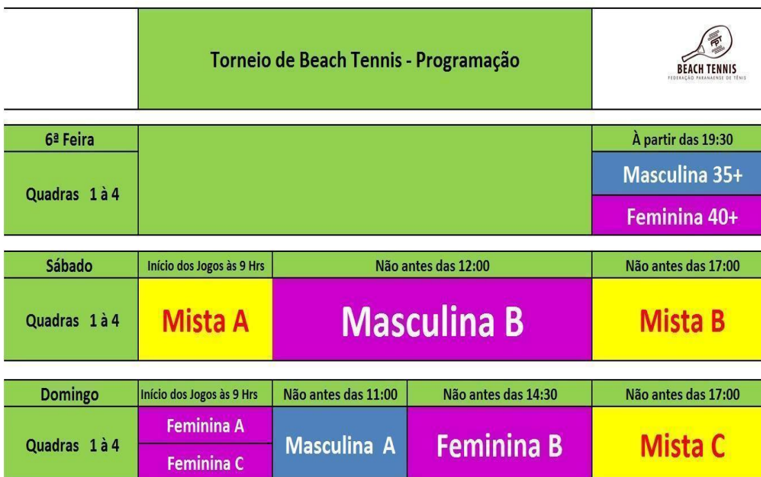
Figura 1 – Exemplo de programação a ser elaborada antes pelo árbitro geral.

* A FPT orienta aos promotores, para melhor competitividade, que o 2o jogo nos grupos com 3 duplas seja feito pelo PERDEDOR do jogo 1 e a dupla que está esperando.